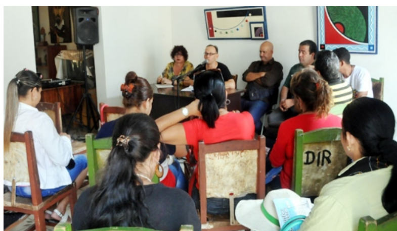
En varios paneles los escritores se acercan a la vida y obra de Eduardo Heras León.