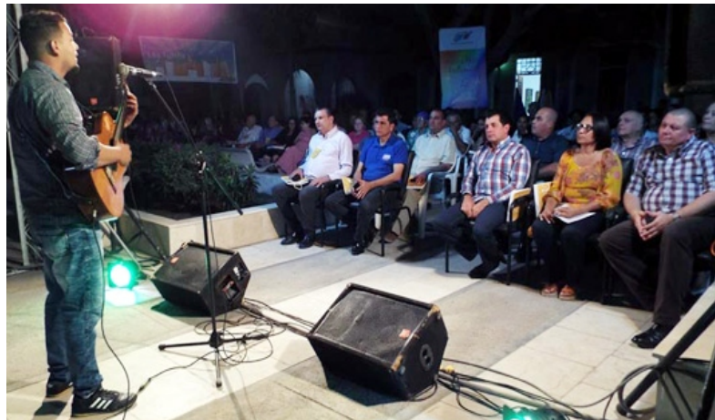
En la noche del martes se inauguró la Feria del Libro, con la presencia de las máximas autoridades de la provincia.