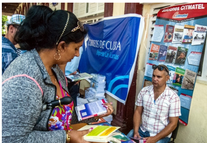
Diversos organismos e instituciones tienen sus propios stands de venta.

Casi 500 novedades literarias y 66 mil 503 ejemplares acompañan a los lectores en la Feria del Libro en Las Tunas, que comenzó este miércoles y se extenderá hasta el domingo, dedicada al Premio Nacional de Literatura y Edición Eduardo Heras León y a la República Argentina Democrática y Popular.