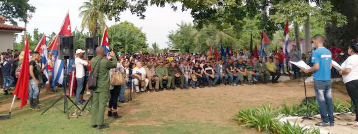
Las principales autoridades del Partido y el Gobierno en la provincia y el municipio presidieron la actividad.