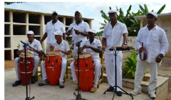
Integrantes de la agrupación La magia del 3 + 2.

"Fundamentalmente cultivamos el folclore y a partir de ahí desarrollamos la rumba y sus formas de expresión: el guaguancó, la columbia y el yambú, más sonoridades de corte religioso".