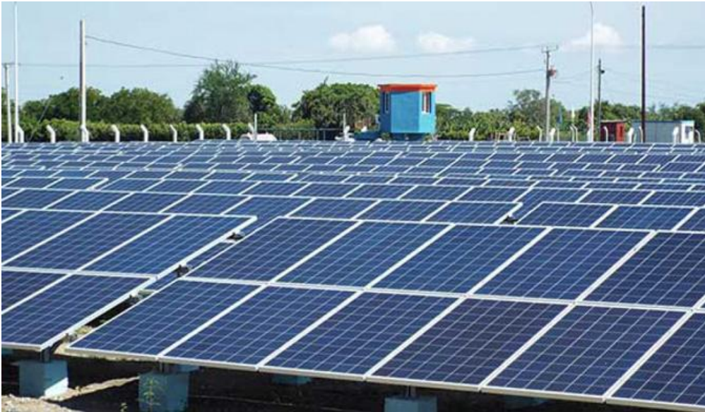
Con dos parques fotovoltaicos, el territorio encabeza la generación de energía renovable en la provincia.