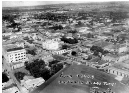
Vista aérea de la ciudad cabecera en los años 50 del pasado siglo.

La imagen en movimiento debutó en el Balcón de Oriente en 1905, cuando abrió sus puertas el cine Victoria, situado donde hoy radican las oficinas de Cadeca, en esta localidad capital. En 1973, las siamesas tuneras Maylín y Mayelín Téllez resultaron las primeras en ser separadas con éxito en América Latina. Durante muchos años, el edificio más elevado de la ciudad fue el teatro Tunas, otrora teatro Rivera. En el siglo XIX, un hombre a caballo traía la correspondencia desde Holguín hasta Victoria de las Tunas. La primera visita de Alicia Alonso a la provincia fue en 1962, y bailó sobre un escenario improvisado en el estadio Velázquez, hoy Julio Antonio Mella. Ninguna mujer en Cuba picó más caña que la tunera Petra Almaguer, la primera fémina Heroína Nacional del Trabajo. José Francisco Zayas-Bazán -hijo del Apóstol- combatió en la toma de Las Tunas de agosto de 1897 al mando del mayor general Calixto García, y fue ascendido a capitán. (Juan Morales Agüero)