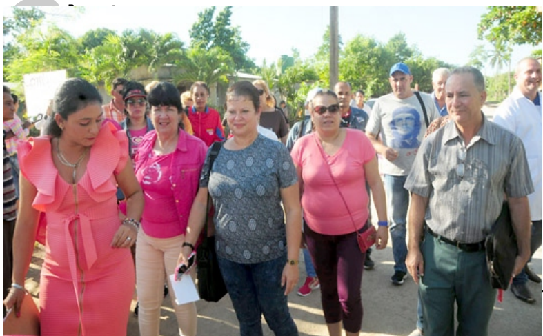
Las autoridades del Partido y el Gobierno intercambian con los vecinos.