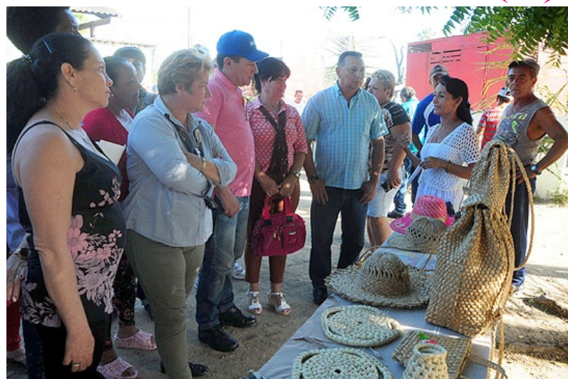
Autoridades del Partido y el Gobierno en la provincia y el municipio departen con los vecinos.

Con motivo de la celebración, la escuela fue rehabilitada y mejoraron sus condiciones de cara al inicio del curso escolar este 3 de septiembre; y otros centros restauraron su ima-