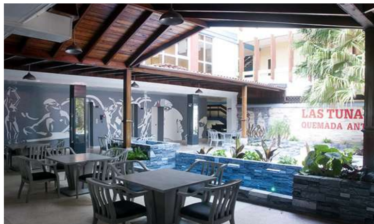
Hotel Las Tunas.