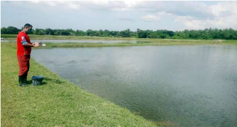
Texto y fotos: Luz Marina Reyes Caballero

CON un ritmo sostenido, las mujeres y los hombres que laboran en la Estación de Cultivos de Especies Acuícolas Manatí (Alevitún) ejecutan estrategias en la crianza de estos animales, para sustituir importaciones y potenciar la exportación.