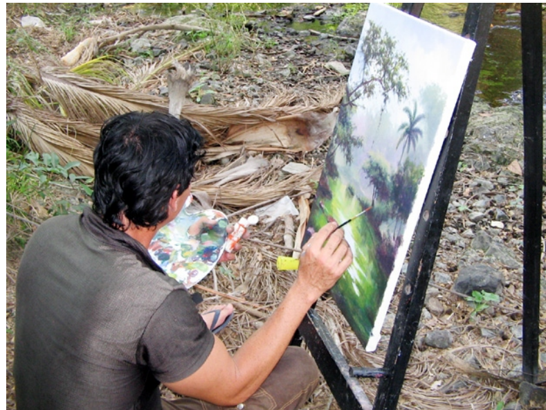
Pintar la naturaleza in situ y, luego, debatir en torno a las obras constituyen potencialidades del evento.

"Que los artistas lleguen hasta la finca Los Velázquez para pintar la campaña, que se realicen talleres con niños de la escuela