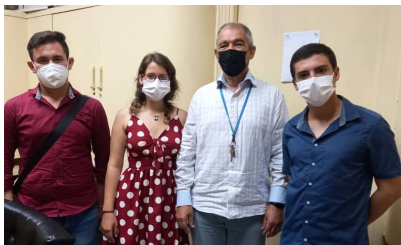
Tres de los estudiantes del proyecto destacaron durante la segunda sesión de trabajo del Consejo Científico del Inimet cuando expusieron los resultados de la investigación.

"El profesor tiene el interés de que no solo nos formemos como científicos, sino como seres humanos con una visión histórica cultural, lo cual es importante para la sociedad en el momento histórico que vivimos", expresa la jovencita que, como bien le enseñó su maestro, busca ante todo ser mejor persona y encontrar el valor o la verdad última de las cosas, las esencias; motivada, como sus compañeros, por la certidumbre de que tanto o más importante que el talento, es el buen corazón.