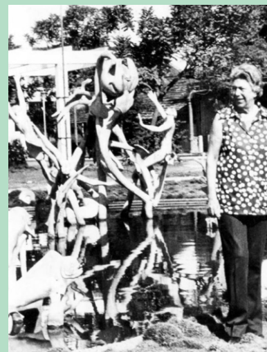
La Fuente de las Antillas, entrañable conjunto.