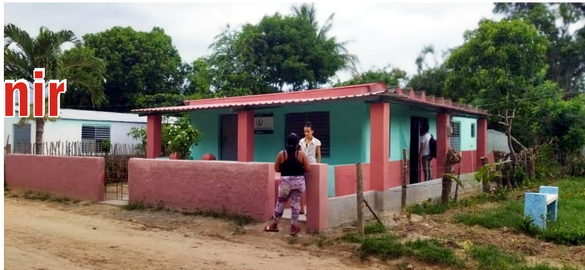
Consultorio 2 de El Rincón.

En la zona se respiran aires de progreso, la bodega exhibe nuevos colores, se han remozado instalaciones, la placita oferta ali-