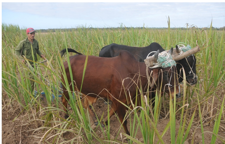
Pelotón cañero de la UBPC Pérez.

Transformar el barrio con la fuerza de los propios habitantes, involucrando a cada uno de sus