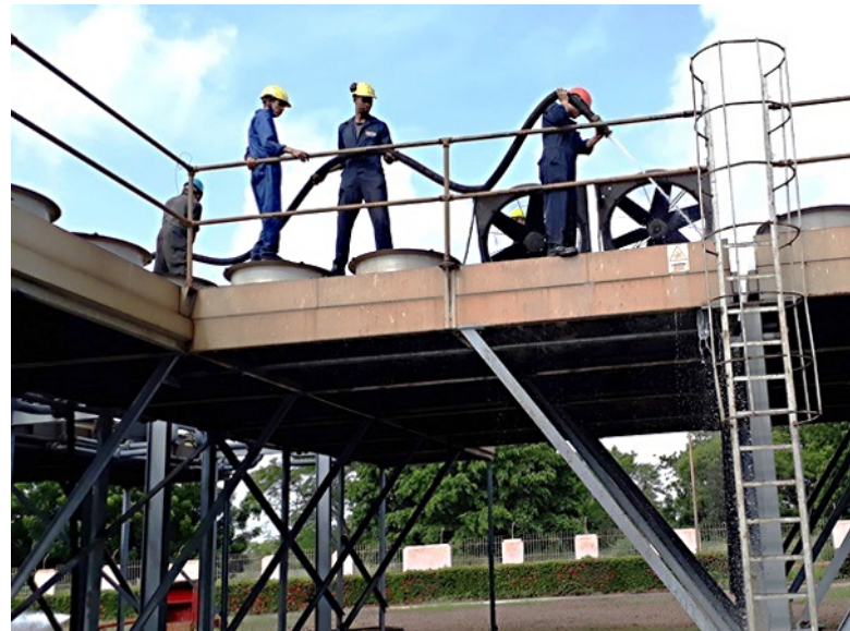
La voluntad de los jóvenes tan alta como los desafíos.

"Por eso no estamos a plena capacidad", argumenta, y destaca la labor de los técnicos y los innovadores, quienes buscan alternativas para mantener la vitalidad de la generación, y todos los días entregan al sistema entre 13,7 y 14 MW.