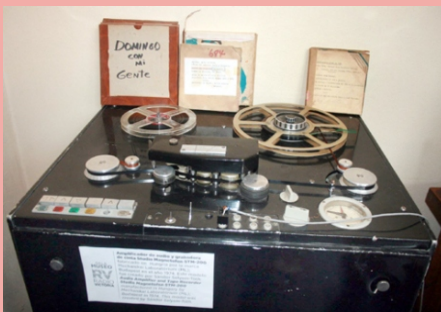
La Sala de Historia, lugar para el patrimonio.

Las seis emisoras y las dos corresponsalías existentes en Las Tunas celebraron este 22 de agosto los 100 años de la Radio cubana. Un festejo que estuvo marcado por el encuentro entre generaciones de radialistas, el diálogo con los públicos y la inauguración de la Sala de Historia del medio, en la sede de Radio Victoria, ubicada en la calle Colón número 157.