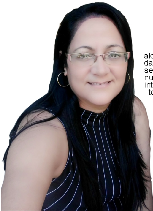
Por Misleydis González Ávila

"¿Está usted de acuerdo con el Código de las Familias?", será esa la pregunta por responder el 25 de septiembre próximo. Yo votaré: SI. ¿Y usted? Si aún no ha leído, lea; interprete y fórmese su propia opinión, libre de juicios preconcebidos. Asegúrese de tener mañana un país mejor; luchar por los derechos de otros, es, también, hacerlo por los nuestros.