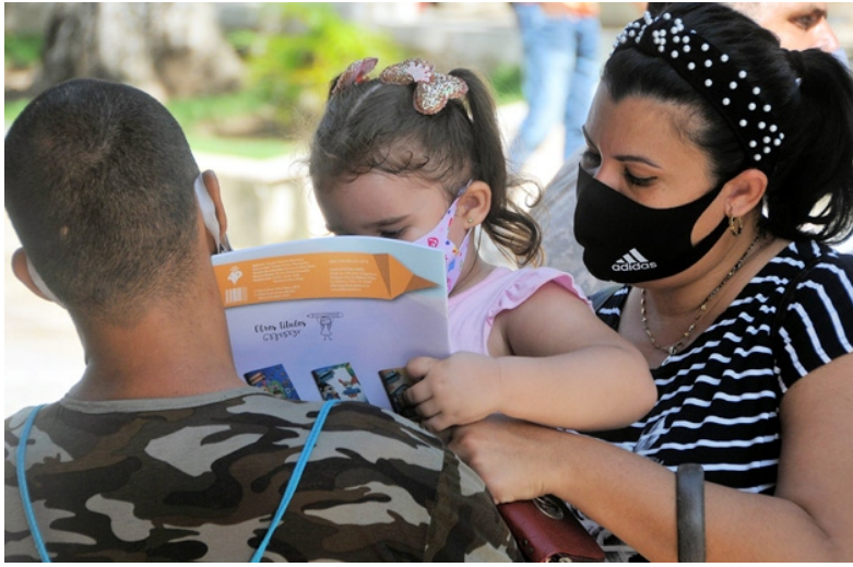
Por Naily Barrientos Matos

R ÍOS de tinta y de opiniones se han derramado aquí, allá y acullá respecto al Código de las Familias que el próximo domingo 25 de septiembre será puesto a disposición del pueblo de Cuba para su ratificación o no en referendo. Hay una paradoja de trasfondo en este asunto, pues se dice que el Derecho llega tarde a legislar u ordenar aquello que ya es parte de la sociedad, tal cual acontece con el texto en cuestión; y, por otro lado, a veces sucede que, como colectividad humana, una norma nos queda "grande" o al menos pareciera que nos falta "mundo" para entenderla.