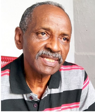
Texto y foto: Miguel Díaz Nápoles

MIRA hacia atrás y ve con satisfacción el camino recorrido. Ya tiene 74 años de edad y su vida ha sido intensa, plena, activa, desde que allá por los campos de Rojas, en Chaparra, andaba con su padre en las faenas agrícolas, por las sabanas, el río, los árboles, junto a sus 12 hermanos que acunaban un hogar muy humilde, pero feliz.