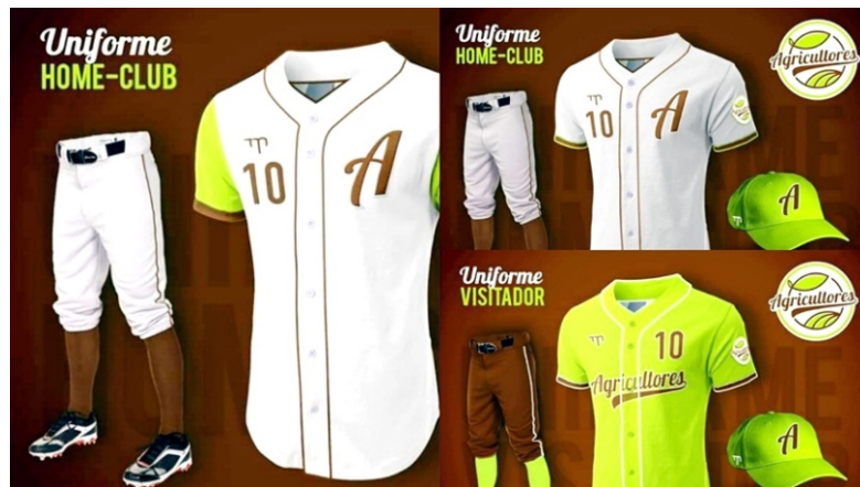
De blanco con mangas verdes y todo de gris serán los dos uniformes de home club; mientras que el de visitante tendrá pantalón marrón oscuro y camisa y gorra verde limón.

Dánel, de 46 años de edad, se encuentra a solo 15 jits de romper el récord histórico de 2378 inatrapables, en poder del capitalino Enrique Díaz. De no concretarse su participación en la Liga Élite, deberá esperar hasta septiembre del próximo año, fecha en la que está previsto el inicio de la 62 Serie Nacional.