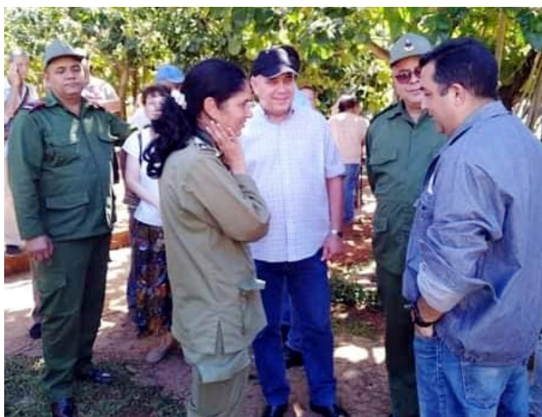
Roberto Morales Ojeda, miembro del Buró Político y secretario de Organización del Comité Central del Partido, reconoció la labor de los tuneros en la capital del país.

Nadie ha dicho cuánto van a durar los quehaceres en el occidente. Los brigadistas comprenden la imposibilidad de estar con los suyos, de la comodidad. Ante los desastres naturales los tuneros entienden de respaldo, de unión, de mano en el hombro. Estos que hoy han sido convocados, los anteriores y los que lo harán en el futuro, no son rostros extraordinarios, sino gente que sabe de solidaridad.