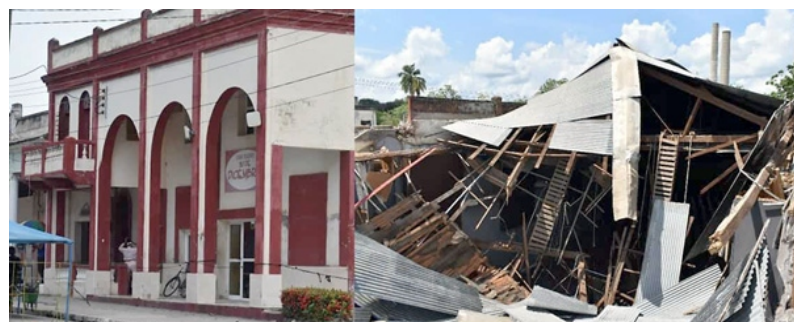
Cine 30 de Diciembre de Jobabo.

Sueños que ojalá se concreten y vengan otros, todos los que sean posibles para mantener vivo el gusto por la "linterna mágica". Algo en lo que se impone pensar con detenimiento y suma dedicación para que no solo renazca la belleza de los inmuebles, sino el alma de la gente, desde el deleite que despierta una proyección cinematográfica.