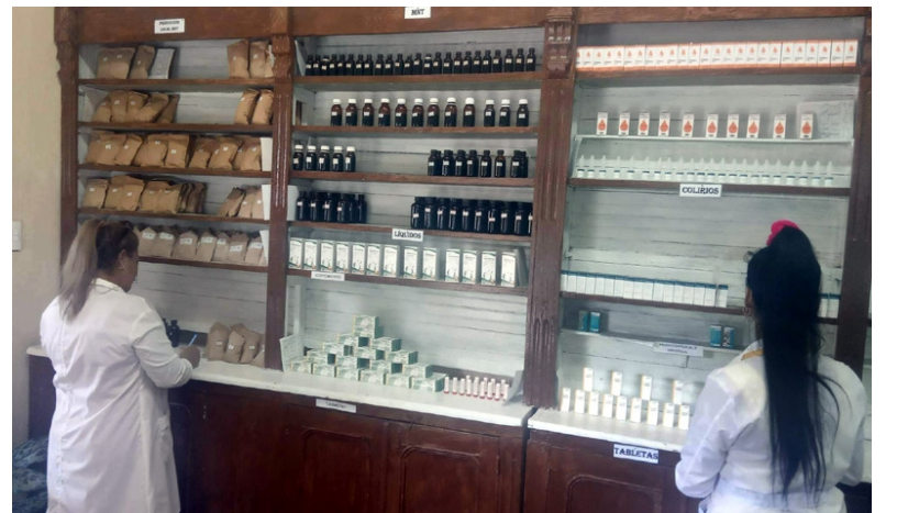
La farmacia Carúpano responde a una reiterada solicitud de los pobladores.