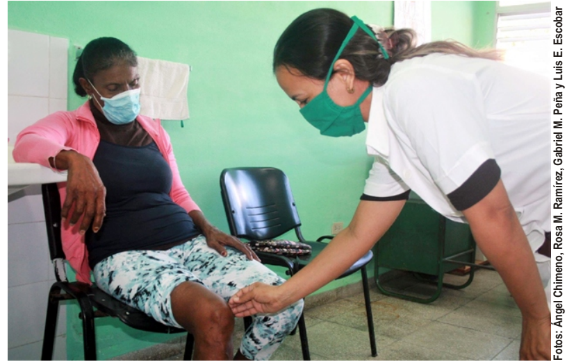
La Sala de Rehabilitación y Fisioterapia del policlínico Manuel (Piti) Fajardo era muy esperada.

Esas instalaciones complementan el espacio de la plaza donde el 31 de marzo de 1996 el Comandante en Jefe Fidel Castro Ruz les habló a los jobabenses en ocasión del cumplimiento de la zafra, lo cual deviene uno de los hechos históricos más relevantes de los últimos 30 años en tierra tunera.