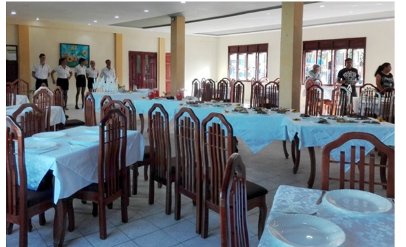
Al restaurante Los Girasoles le toca ahora garantizar la calidad del servicio.