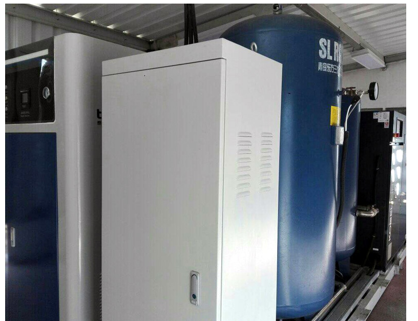
La planta de oxígeno del "Guillermo Domínguez" es una garantía de salud.