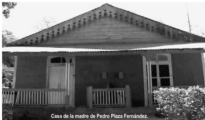
Casa de la madre de Pedro Plaza Fernández.

Entre lo más significativo de su quehacer estuvo la entrega de bienes y viviendas que antes pertenecían a familias ricas que emigraron a Estados Unidos tras el triunfo revolucionario. Sobre este aspecto, Juanito evocó: "Todavía muchas personas que habitan en casas confortables o atesoran objetos valiosos, dicen con orgullo que ella se los dio gratuitamente.