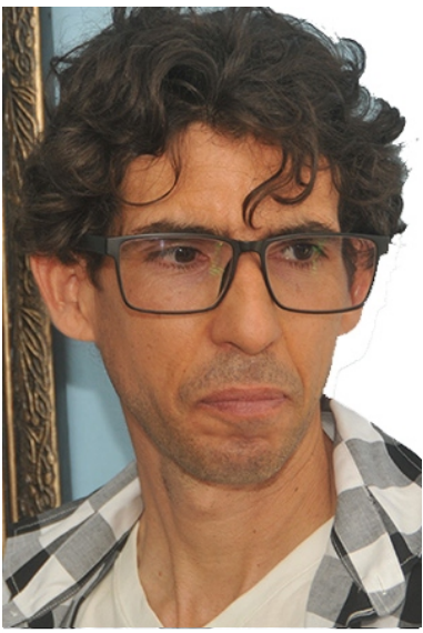
Por Yuset Puig Pupo

F RENTE a la gran pantalla electrónica del aeropuerto internacional José Martí tuvo unos momentos, cuando menos de vacilación. Repasó los documentos y en la mente hizo una lista del equipaje: cámara fotográfica, laptop, poquísima ropa, algún que otro abrigo, los zapatos gastados de perseguir coberturas, espejuelos... todo en orden. Entonces vio al pasaporte rojo abrirle paso hacia un destino que sus horizontes no habían acariciado jamás.