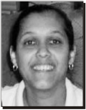
Por Esther De la Cruz Castillejo