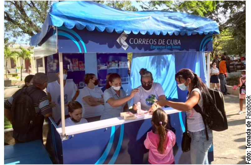
Correos no deja de aprovechar una oportunidad de venta. La Feria del Libro 2022 fue un ejemplo.

En este caso, destacan los giros postales internacionales, los envíos hechos mediante correo oficial, la paquetería asociada a las ventas online de la cadena de tiendas Caribe, así