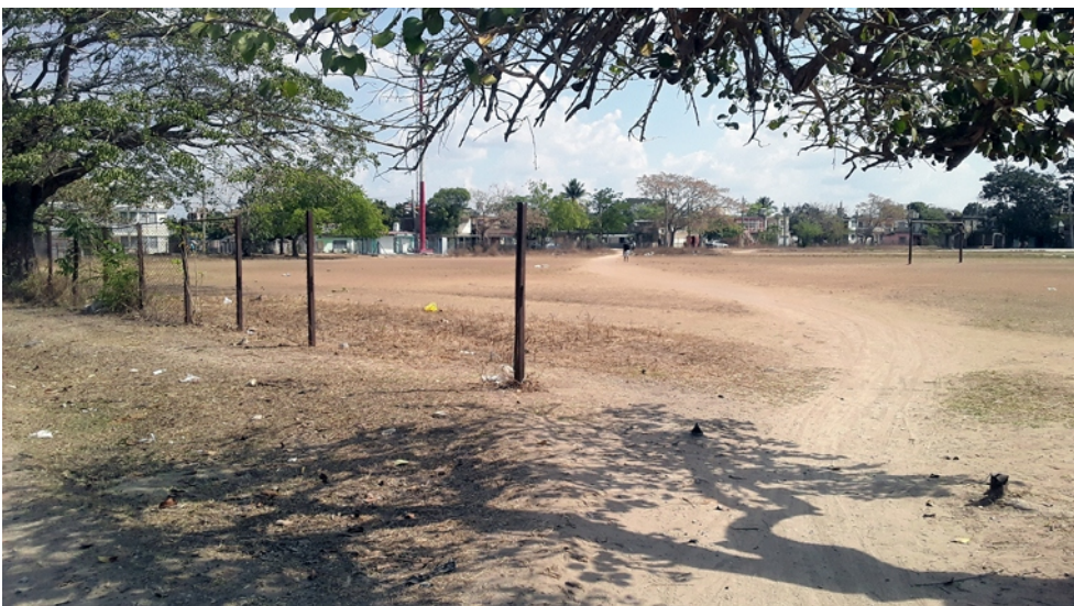
La cerca perimetral del área deportiva aledaña al centro escolar Jesús Argüelles prácticamente ya no existe. Por eso, de lo menos que ahora allí sucede, es que una pelota de fútbol termine en la cabeza de cualquier transeúnte. No hablemos de la seguridad de los niños que juegan en ese espacio y dan sus clases de Educación Física.

Entre esas “joyas” están la solidaridad, la responsabilidad, el respeto, la justicia, la cooperación, la honestidad, la cortesía, la autonomía y la tolerancia. Entonces, la educación cívica hay que cultivarla y nutrirla desde la familia y la escuela, pero debe exigirse también por parte de las instituciones y el poblador más común; solo así se fortalecerá el papel del ciudadano. Cualquier eslabón flojo en esa vigilancia herirá sin remedio la decencia y la posibilidad de la concordia.