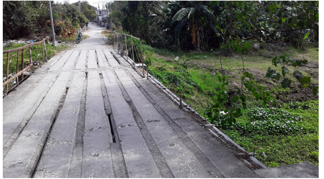
Así quedó el puente de la calle Colón que conduce a la parte de atrás del parque 26 de Julio. Gente inescrupulosa se ha llevado casi todas las barandas, y las probabilidades de accidente crecen cada día.