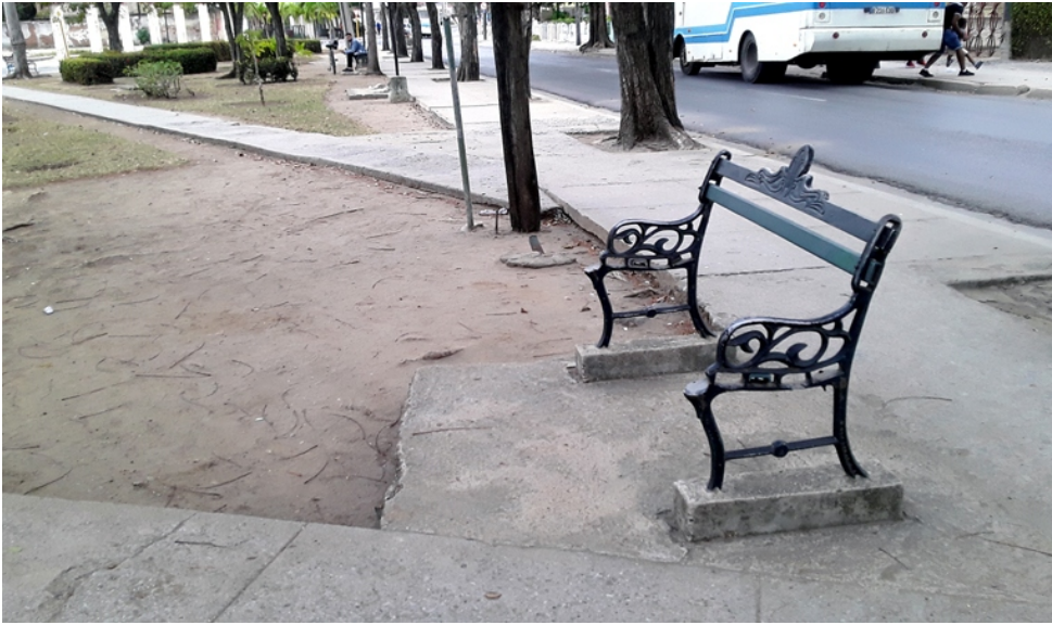
La mayoría de los bancos de la plaza Calé han sido destruidos varias veces. Servicios Comunales los repone y al rato... en las mismas.