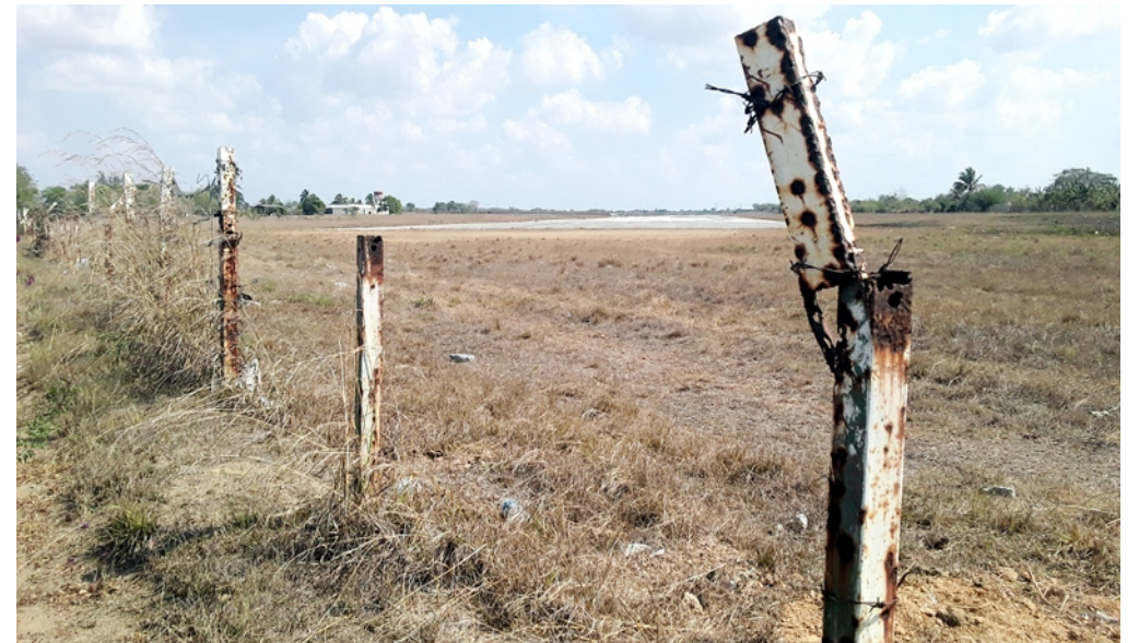
Aunque el Aeropuerto está inactivo, es lamentable que quede así, en manos de la depredación.