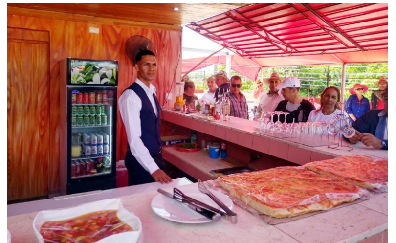
Terraza de la Casa de Cultura.

El homenaje al Día de la Rebelión Nacional deviene en el municipio de Jobabo y en Las Tunas punto de partida para continuar en la forja de una historia que tuvo en julio de 1953 uno de sus capítulos más hermosos e intrépidos.