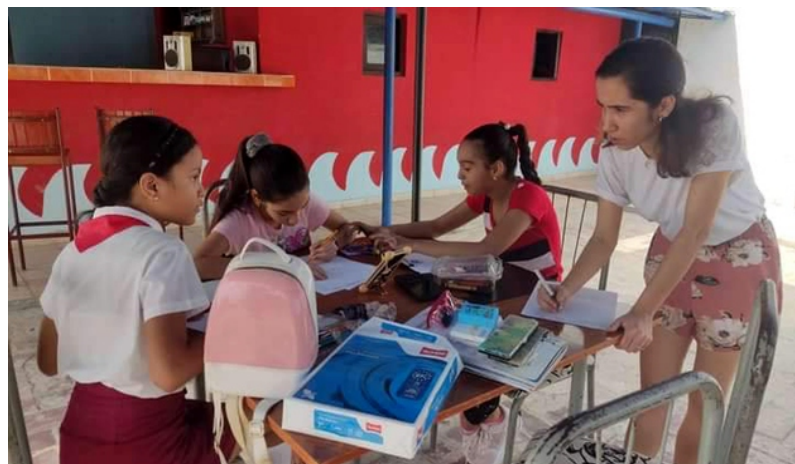
La sede tunera de la Asociación Hermanos Saiz impulsa talleres de verano, dirigidos fundamentalmente al público infanto-juvenil.

Generar acciones semejantes, desde la creatividad y el aporte colectivo, es menester en los diferentes territorios, máxime ante limitaciones reales como teatros cerrados por problemas de infraestructura y otra índole. Nuestro pueblo lo merece, lo necesita.