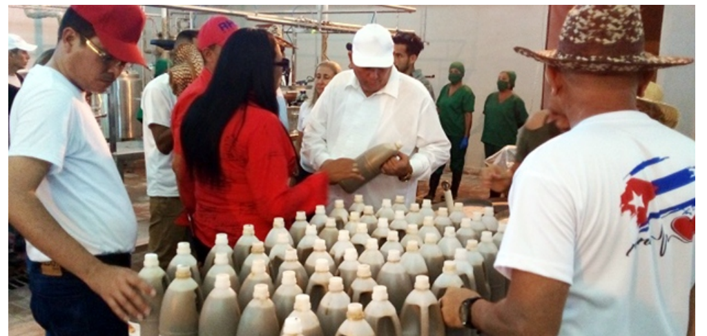
Fábrica de conservas.