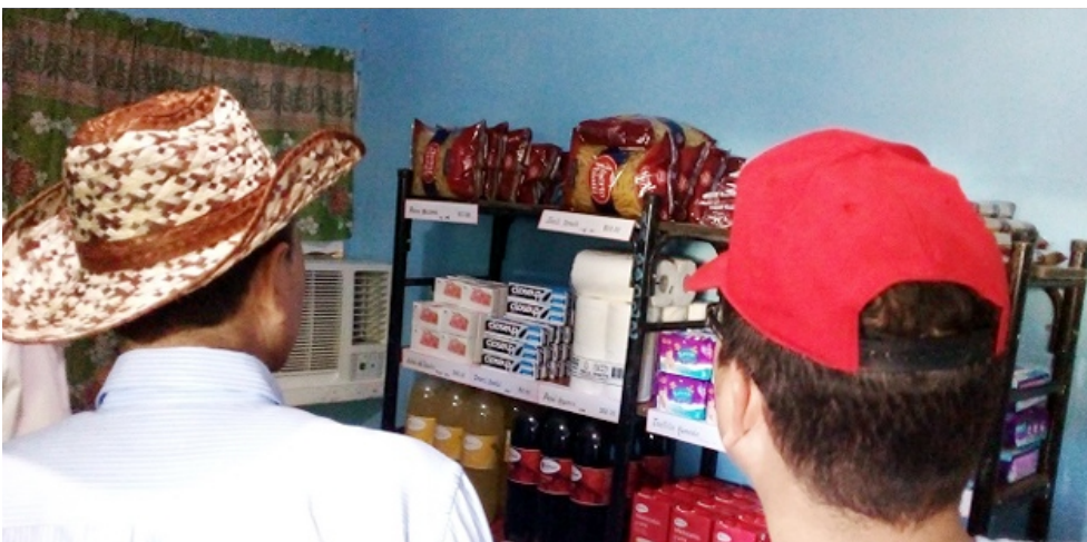
Tienda de la Planta de Beneficio de Carbón.