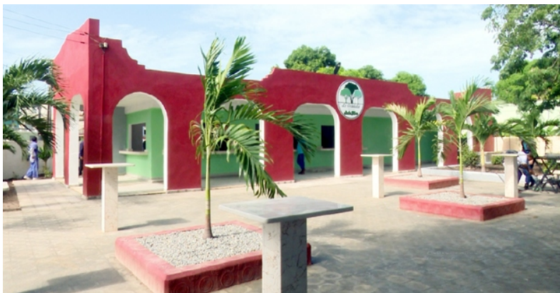
Cafetería Soda Libre.