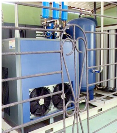
Planta de oxígeno.

Asimismo, quedaron inauguradas tres viviendas adaptadas en un antiguo local de vectores