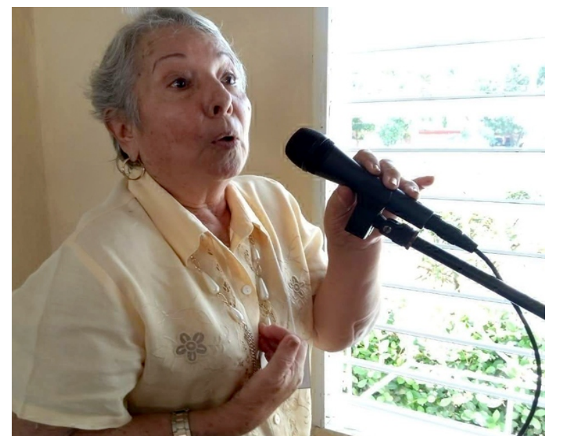
Las federadas majibacoenses abogaron por una FMC con mayor impacto social.