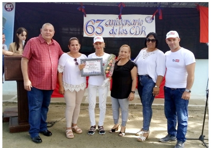
Entrega de la Condición de Vanguardia Nacional al municipio de Majibacoa.

En este nuevo aniversario de los Comités no hubo caldosa tunera en todas las cuadras de Majibacoa, pero al menos una por circunscripción o por consejo popular se intentó garantizar y volvió a ser la unidad ingrediente vital del festejo. Sumado a la alegría de los pobladores por haber recuperado el lauro que los ubica entre los más destacados del país.