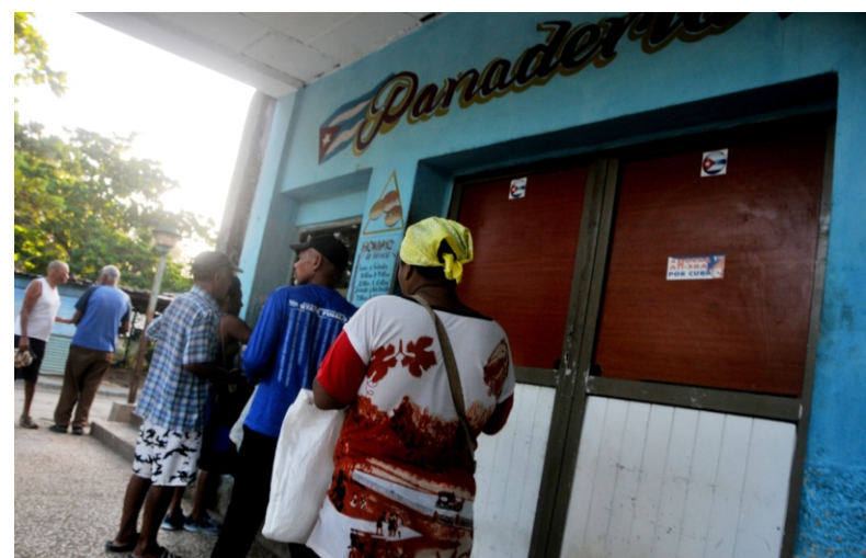
El pan de la bodega trae tranquilidad en muchos hogares.

“Cuando esto sucede y llega a altas horas de la noche, se hace un esfuerzo inmenso en la transportación en función de que podamos cumplir el encargo estatal, somos conscientes de la necesidad de la población en medio de estas condiciones difíciles.