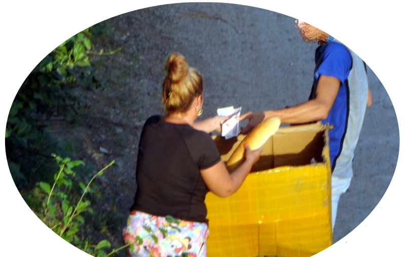
La falta del pan normado obliga a recurrir a ofertas caras.

Algo sí va quedando como sentencia: cada vez resulta más evidente la capacidad del particular para mantener a flote sus negocios y la imposibilidad estatal para poner en los hogares tuneros, el pan nuestro de cada día.