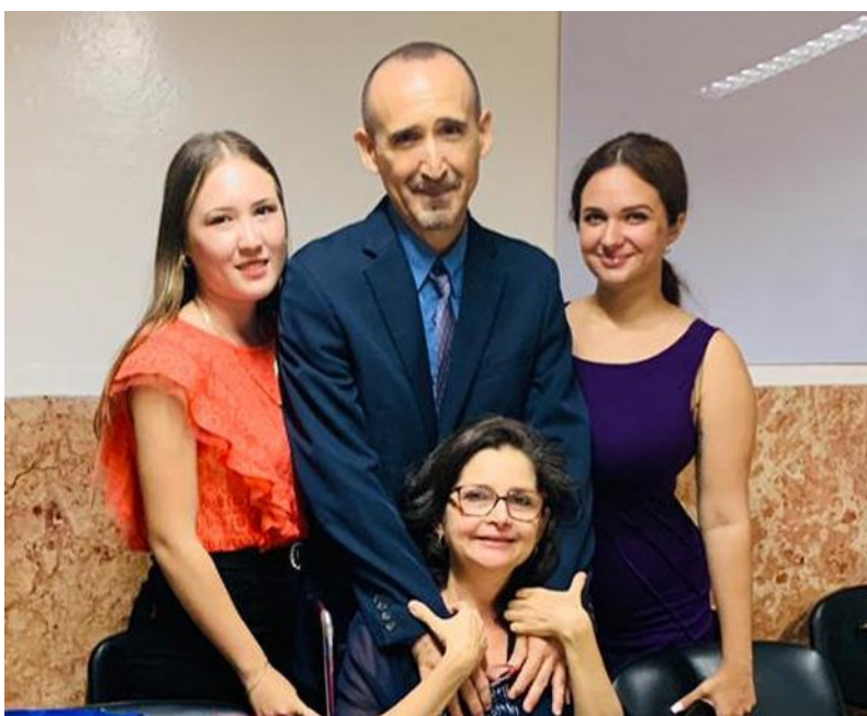
La familia, siempre sostén.

“La Medicina es una profesión y una ciencia de mucho amor y bondad, por encima de todas las cosas”.