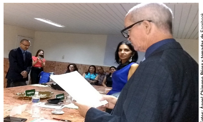
Obtener el título de doctor en Ciencias fue otro momento de gran crecimiento profesional y personal.