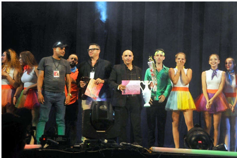
La compañía Huracán Mágico, de Las Tunas, obtuvo el gran premio del Ánfora.

El desfile, además, no vislumbró el colorido, la variedad ni la identificación adecuados. Sin cartel o pendón propios del evento, existía, solo que no se mostró allí; sin los accesorios "mágicos" distintivos -singulares sombreros, palomas, naipes, trajes alegóricos...-, el público que transitaba ese día por los laterales de la calle Vicente García no sabía qué tipo de periplo ocurría. Si a eso le sumamos que niños uniformados casi encabezaban el itinerario y que los