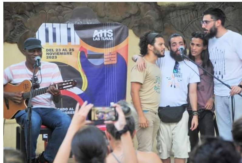
El Entre Música propició la confluencia de valiosos artistas.

En resumen, tanto el Ánfora como el Entre Música merecen perpetuarse en el tiempo. Sabernos parte de sus latidos y ayudar en lo que podamos es buena manera de defender el espíritu de la cultura, los tuneros y la ciudad, en general.