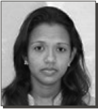
Por Naily Barrientos Matos