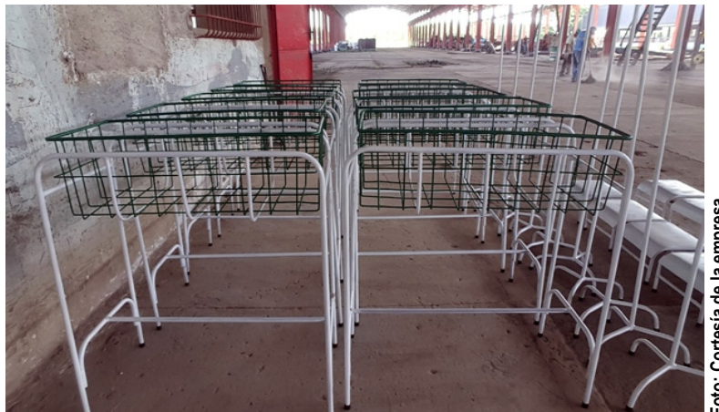
Estos implementos hospitalarios, además de su gran utilidad, hablan de la capacidad de innovación de Acinox Las Tunas.

"Todos estos mecanismos posibilitan un ingreso considerable en ventas, y luego concretar utilidades razonables. Mientras, seguimos apostando por las inversiones a mediano y largo plazos, porque el desarrollo de esta industria reside