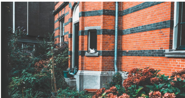
Un ejemplo de edificaciones con ladrillos a la vista.