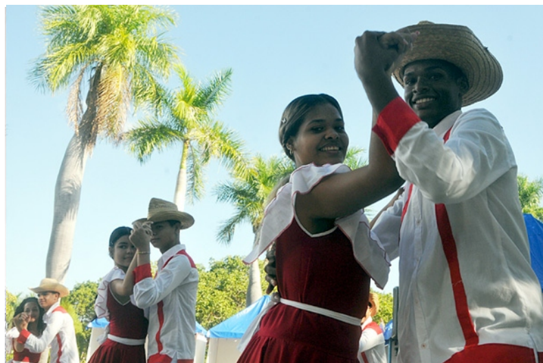
La oferta de servicios culturales se integra a la estrategia de exportación.

Al cierre del 2023, la Dirección de Comercio Exterior, Inversión Extranjera y Cooperación Internacional en suelo tunero logró ventas para la exportación ascendentes a 608 mil 717 pesos, del millón 125 mil 514 planificados. Los incumplimientos estuvieron relacionados con las producciones de las empresas Acinox Las Tunas, la Productora de Carbón, la de Acopio, Beneficio y Torcido de Tabaco, y la Azucarera, funda-