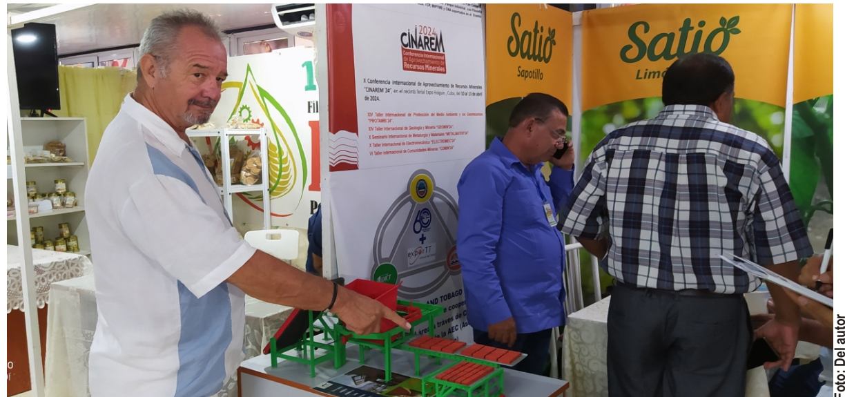
Margrina muestra la maqueta de la planta productora de ladrillos a la vista en la Feria de la Industria y el Comercio.

"Eso puede contribuir a la producción de alimentos, porque los cerdos, las aves o el ganado criados en esas condiciones tienen mejor salud por las bajas temperaturas y, por consiguiente, el rendimiento es mayor".