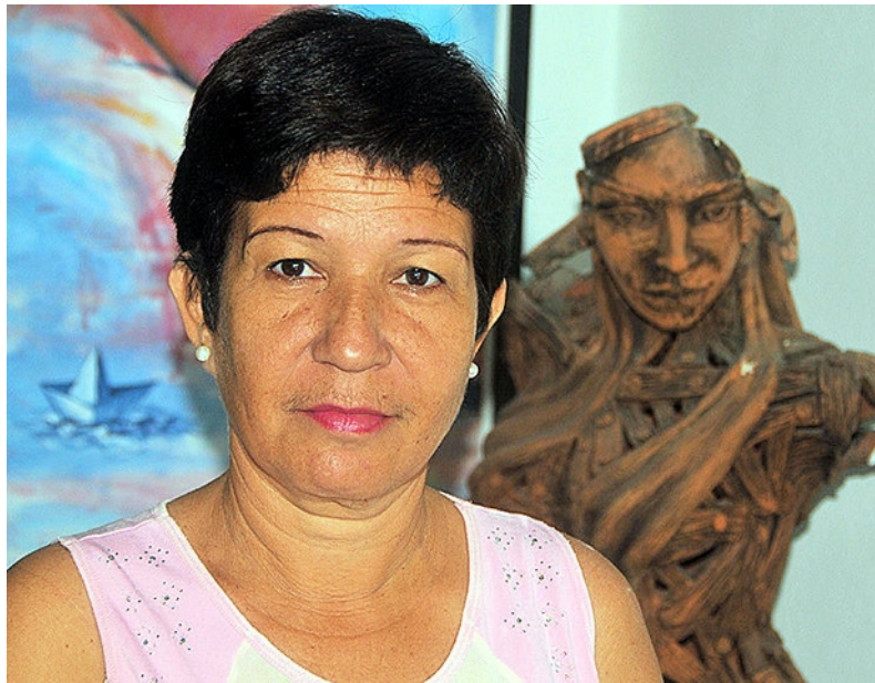
Por Yelaine Martínez Herrera

Cada 18 de Febrero se celebra en Cuba el Día del Instructor de Arte. 26 saluda la fecha con una entrevista a uno de esos seres imprescindibles