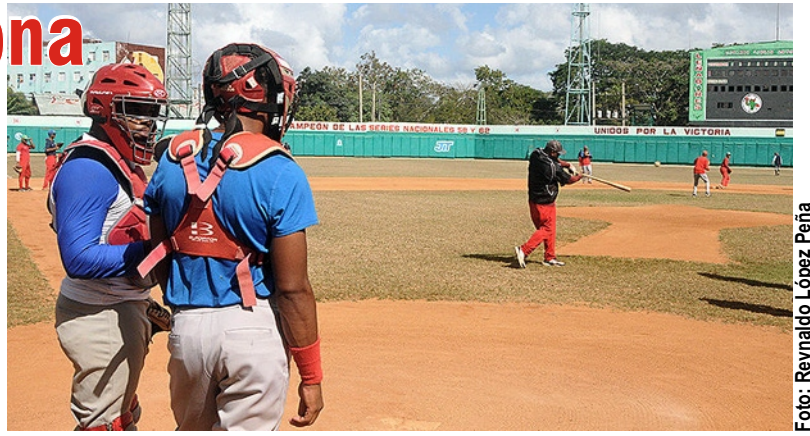
El equipo tunero está enfrascado en su preparación.