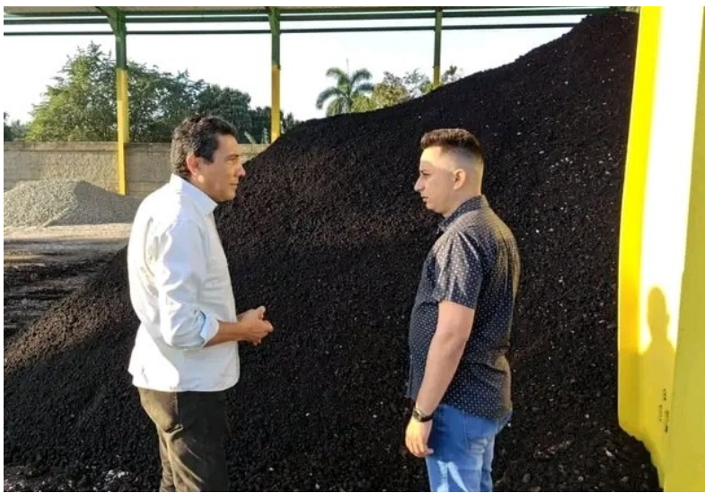
La visita del ministro del Transporte (a la izquierda) marcó un momento importante en la historia de esta iniciativa.

El mayor beneficiado con la faena de AsfalTunas es el pueblo, que en los últimos días ve algunas calles con “rostros” remozados que dicen adiós a baches legendarios; y se prende la esperanza de que la enorme demanda al respecto pueda ser en algún instante satisfecha, sumado al nada inestimable aporte a la durabilidad de los vehículos y la prevención de accidentes.