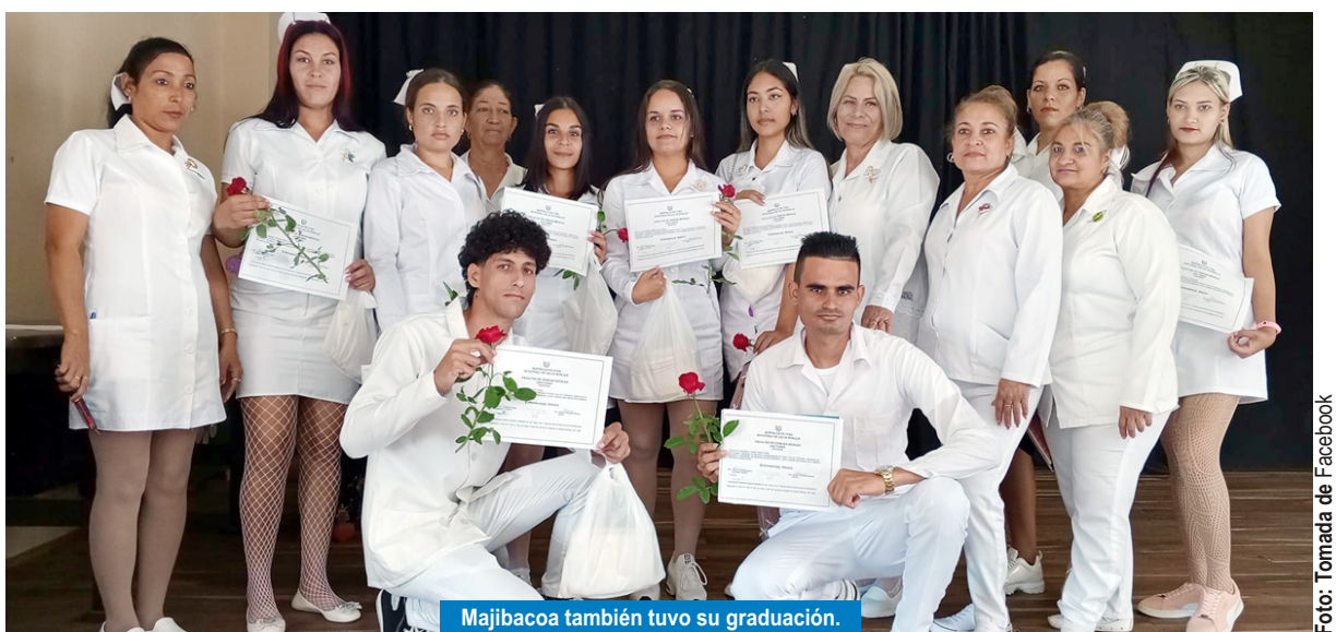
Majibacoa también tuvo su graduación.

los 35 años de edad. La Universidad de Ciencias Médicas de Las Tunas guía todo el proceso.