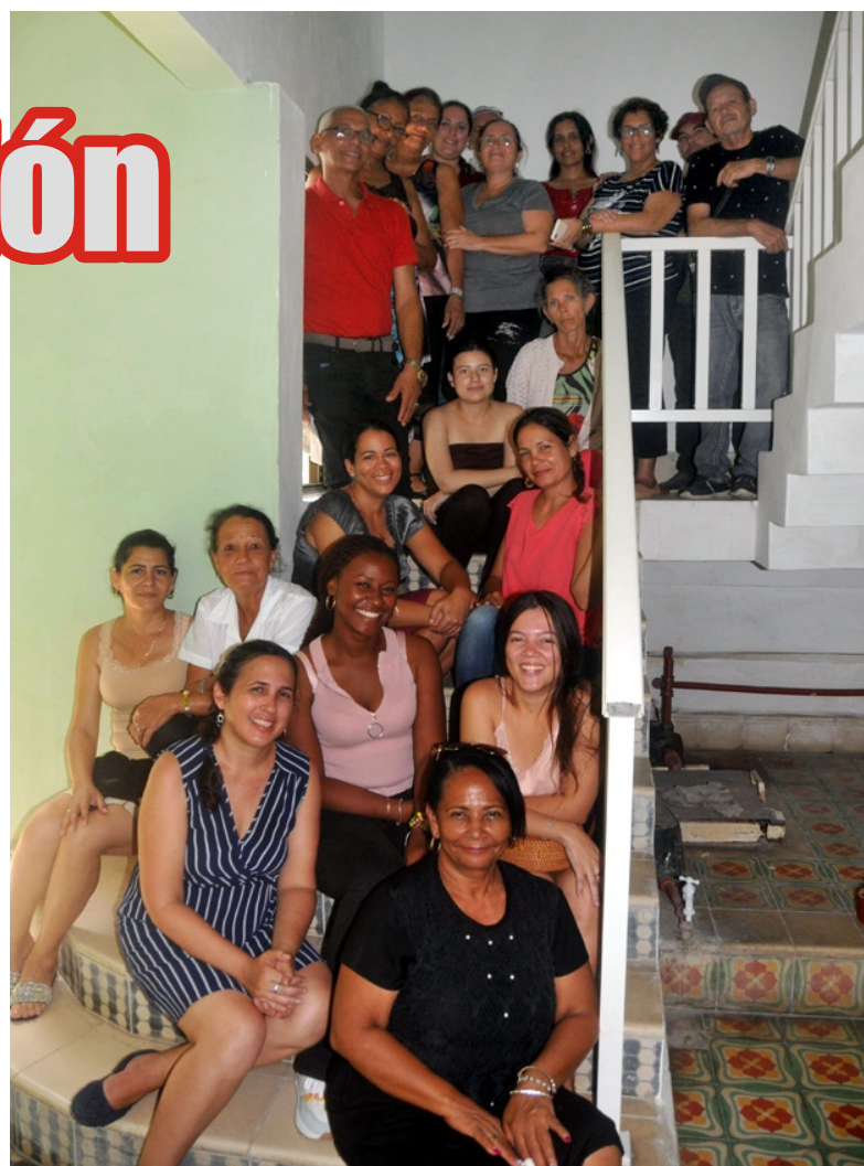
En la historia de 26 siempre hay una escalera... El nuevo local tampoco es la excepción. Seguiremos subiendo peldaños.

"Desde el punto de vista de la primera, nos consolidamos como un multimedio de prensa, con el