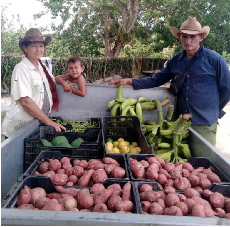
Por Liodany Arias Tamayo (ACN)

P RODUCTORES de Manatí son beneficiados con recursos y asesoramiento técnico, a través de un plan de acción para mitigar los efectos de la sequía en ese territorio, con asesoramiento técnico y logístico en