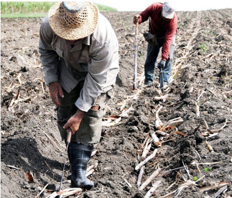
Texto y foto: Jorge Pérez Cruz

EL INCUMPLIMIENTO de la siembra de caña de primavera, con solo el 38 por ciento del plan y el ritmo de la de frío, en la que está inmerso el sector, es una amenaza real a la sostenibilidad de la producción azucarera en la provincia, un territorio comprometido por sus potencialidades con los programas de desarrollo de la nación en este frente que es cultura, tradición e identidad.