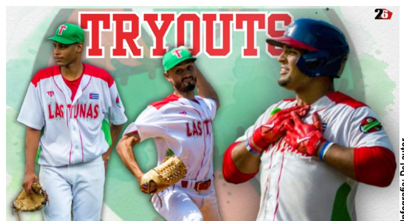
Infografía: Del autor

“Los jugadores de las categorías Sub-15 años y juveniles muestran gran talento, tal vez no para un futuro inmediato como lo que se avecina, pero sí