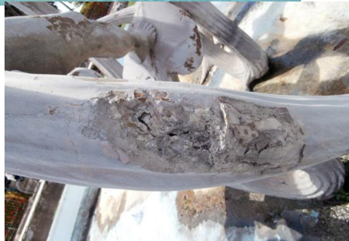
De las heridas que no deben volver a esta obra patrimonial.

llega a ser hasta risible que, transcurrido un quinquenio, las cuatro piezas originales están (ya restauradas) a resguardo en el sitio exacto donde conversamos y nadie más se haya preocupado por ellas. Las conocimos de la mano de Olano, están empolvadas y, a pesar de eso, hermosas. Es una pena que no fructificara la idea de incluirlas en la colección de la galería taller de escultura Rita Longa. ¿Estarémos a tiempo?