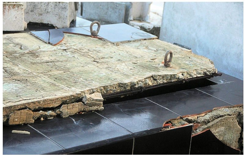
Un día la losa está, puede que al otro no.