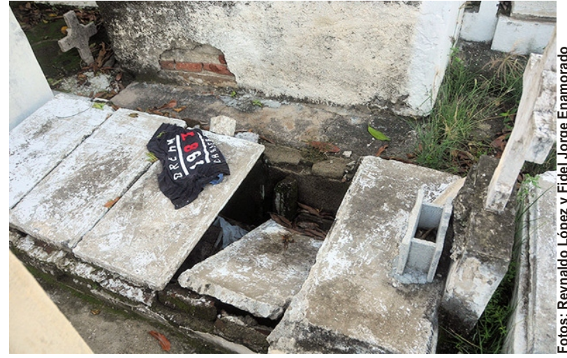
Indisciplinas y deterioro, la marca del dolor.

El joven directivo explica que lo referido al camposanto es todavía más enrevesado. "Estamos esperando una nueva ubicación para comenzar las faenas, porque la que antes teníamos, al lado del incinerador y donde ya habíamos comenzado los primeros movi-