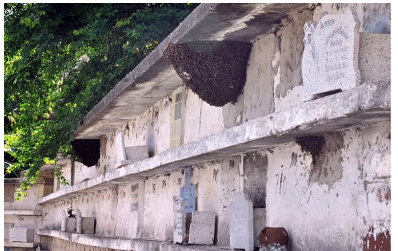
Panales de abejas suman dificultades.

mientos de tierra, se la dieron a unos particulares".