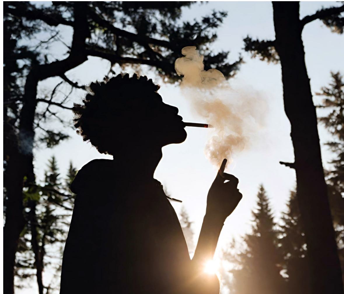
Imagen generada por inteligencia artificial

Fue un ambia del barrio el que le comentó un día. "Socio, si a ti te gustan las pastillas y eso, seguro le descargas a la talla esta", y le dio a probar el quimico, la droga que