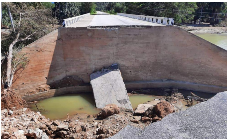
Así se encontraron los constructores tuneros el puente que da paso a Imías.

Solo cuatro o cinco horas descansan diariamente estos hombres, cuyo empeño dice mucho de la fibra solidaria de los hijos de la tierra de Vicente García.