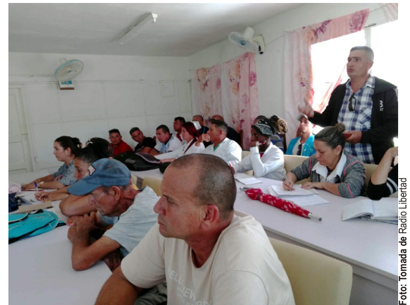
En Puerto Padre se insiste en la integralidad del enfrentamiento.

Explicó que preocupa el panorama en el territorio sureño por que históricamente ha sido muy estable en la campaña de vigilancia y con la focalidad. "Es una