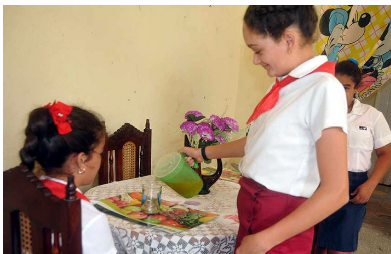
Que logren su realización personal y sean útiles, un interés marcado de la Enseñanza Especial con sus alumnos.

"Como institución, nuestro papel es contribuir con el diagnóstico de los infantes que