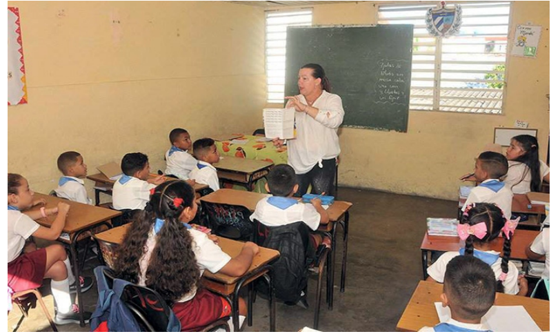
Cualquier escuela regular puede ser un exitoso escenario de inclusión, pero se requiere capacitación y unidad del claustro, más los debidos apoyos.

“En la localidad capital, la escuela Alberto Arcos Luque podría ayudar al respecto porque es grande, pero está en la salida de Jobabo; es difícil llegar hasta allá y las familias se niegan. Tiene una guagua que apenas sale por el combustible”.