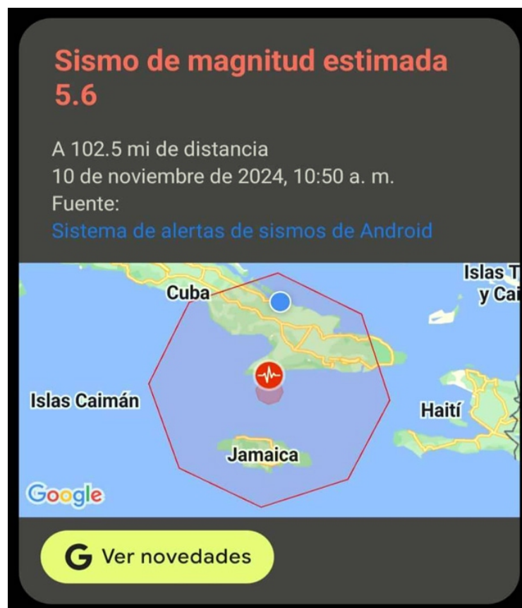
Un mensaje así recibieron muchos tuneros en su celular.

El episodio más reciente desató un sinnúmero de reacciones y publicaciones en las redes sociales, algunas simpáticas, otras cercanas al pánico, porque lo vivido aconteció en un contexto marcado por las adversidades. La realidad es que, de a poco o de mucho, como lo remarcaron los internautas, “el domingo fue día de temblor en Las Tunas”.