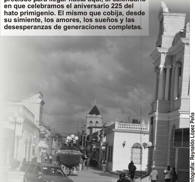
Infografía: Reynaldo López Peña

Mucho llovió desde entonces hasta el año 1853 cuando, por Real Cédula, se le otorga el título de ciudad. Lucía ya una iglesia, reedificada, incluso, en 1820; la población superaba los nueve mil 447 residentes y desde el 20 de diciembre de 1847 estaba creada la Tenencia de Gobierno de Las Tunas. Claro, incontables otros aguaceros fueron precisos para llegar hasta aquí, al calendario en que celebramos el aniversario 225 del hato primigenio. El mismo que cobija, desde su simiente, los amores, los sueños y las desesperanzas de generaciones completas.