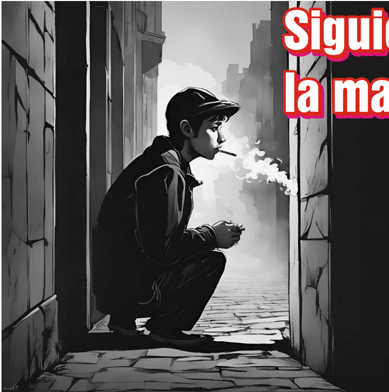
Imagen generada por inteligencia artificial