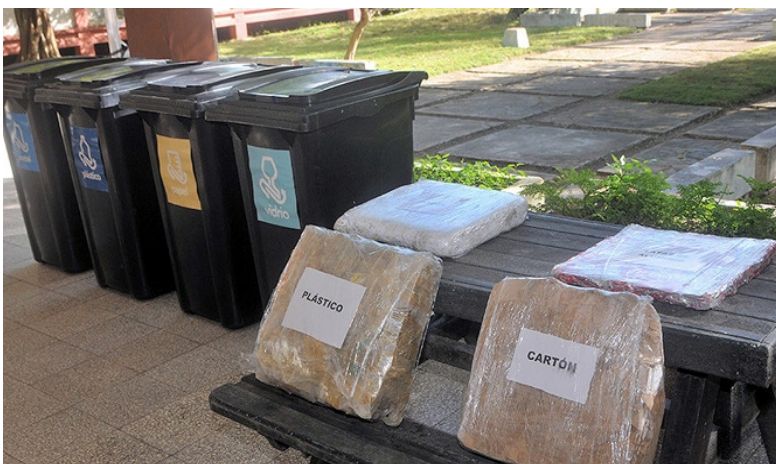
La ciencia tiene mucho que aportar a la resolución de problemas sociales.