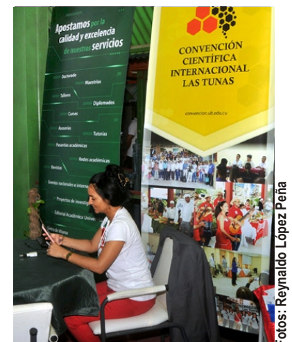
La Universidad de Las Tunas, con su potencial científico e innovador, es un ente esencial.

Sin dudas, una faena de apremio que exige talento, sensibilidad y apoyo para hacer a Las Tunas mejor, desde la labor científica y sus respuestas.