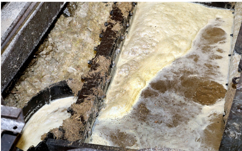
En el camino de la caña al “Guiteras” hay historias como la de Picanes.

La UBPC, aunque es eminentemente azucarera, posee una finca, un módulo pecuario y persevera por que sus trabajadores tengan los mejores ingresos posibles.