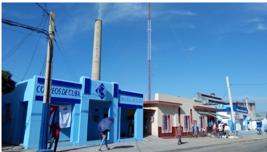
Texto y foto: Arbelio Alfonso González

CUANDO este domingo el almanaque señale que llegamos al último día del mes de febrero, la ciudad capital del municipio de Colombia estará cumpliendo 105 años de su fundación.