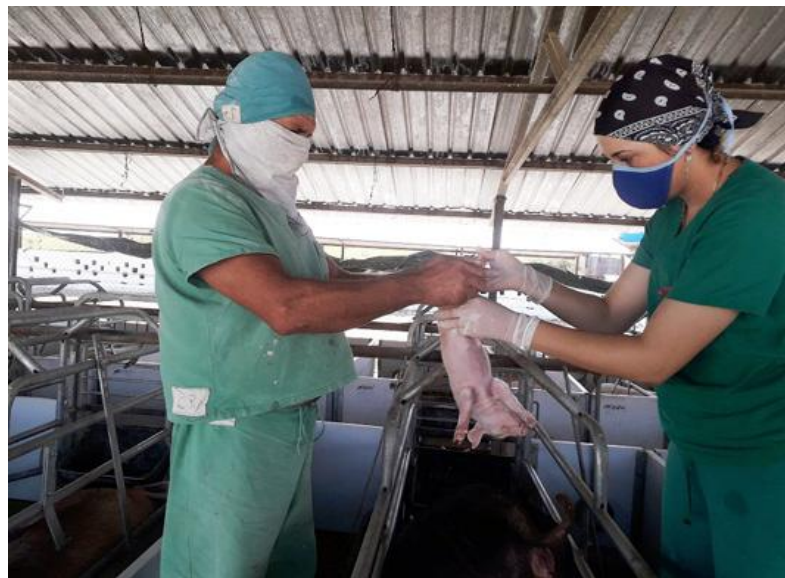
La atención veterinaria ha permitido la disminución en las cifras de muerte animal.

"El plan inversionista se ha perfilado hacia esas dificultades, y se ejecutan la construcción de un badén para la desinfección de los