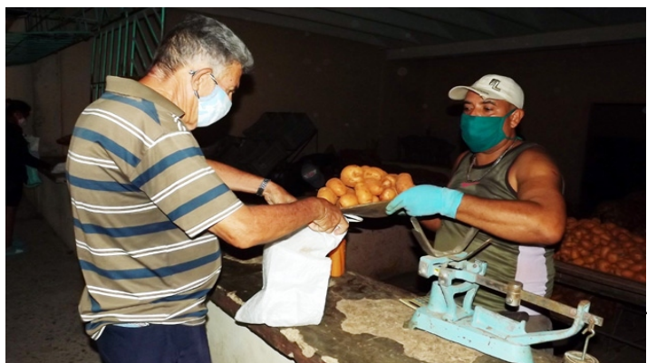
A 3.00 pesos la libra llega la papa a los tuneros.