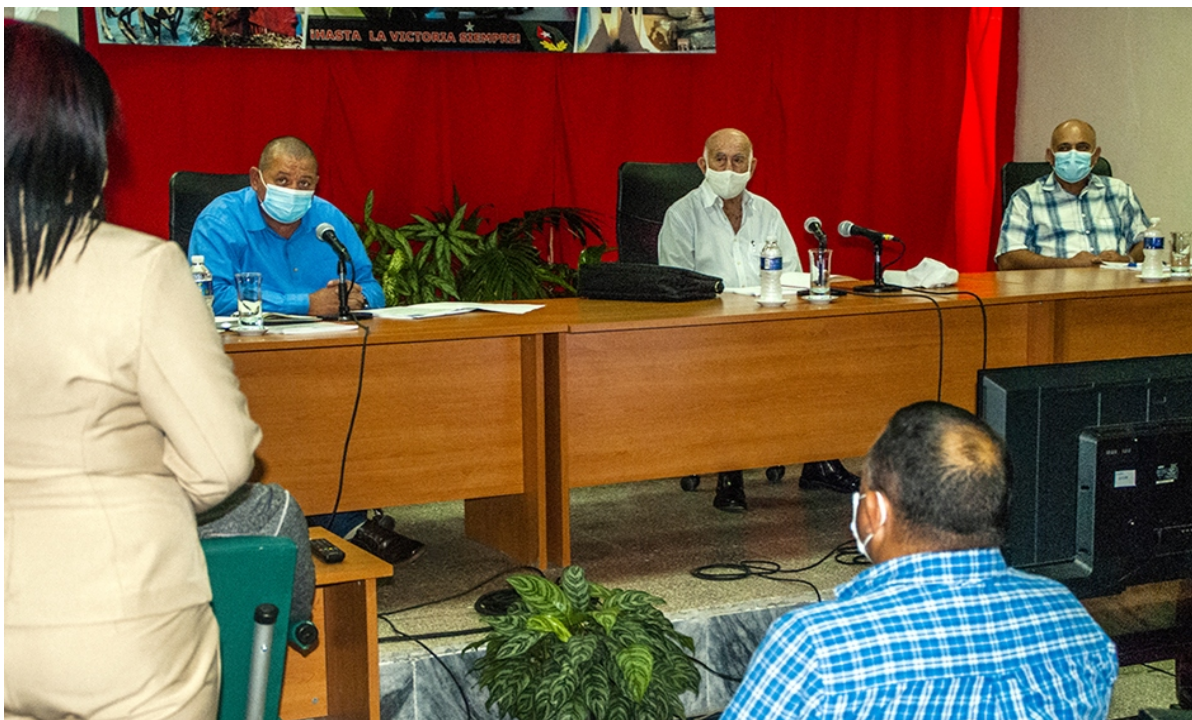
Texto y foto: István Ojeda Bello

ÓRGANO DEL COMITÉ PROVINCIAL DEL PARTIDO EN LAS TUNAS