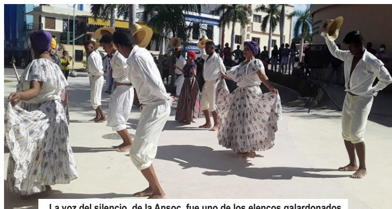
La voz del silencio, de la Ansoc, fue uno de los elencos galardonados.

Durante la venidera Fiesta Suprema del Campesinado Cubano los veremos de manera virtual, nueva oportunidad para apreciar interpretaciones de El cañaveral , Pájaro lindo , Choncholí se va pa'l monte o cualquier otro tema compuesto por los mismos integrantes de esa cofradía. Seguramente, en algún lugar de la historia, estará sonriente cierto cantor y poeta mambí.