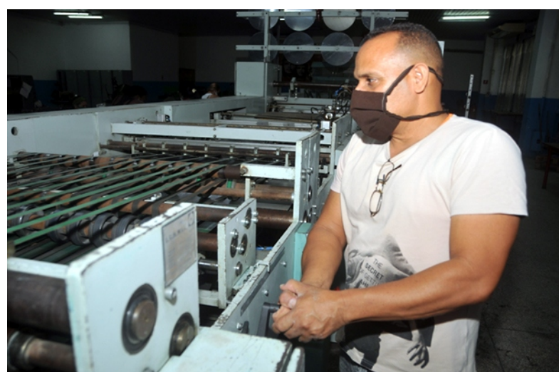
Los trabajadores que permanezcan en ingreso domiciliario tienen derecho a la totalidad del salario básico. Los que estén en centros de aislamiento se acogerán a las regulaciones de la Seguridad Social.