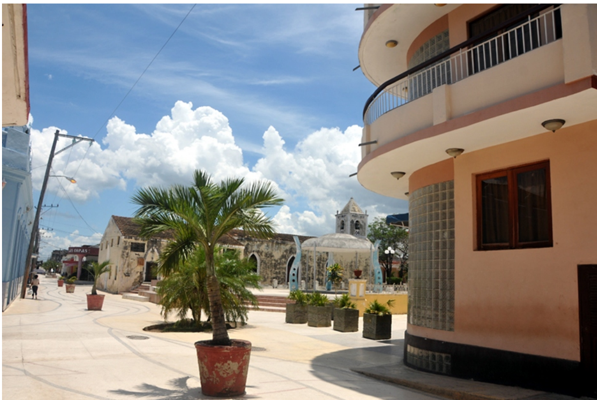
Las autoridades sostienen que mantener el distanciamiento social y acatar las medidas de bioseguridad es la manera más efectiva de detener el contagio.

"Lo más importante es propiciar la organización de la actividad comercial para evitar las aglomeraciones, por eso, deben potenciarse las ventas a domicilio".