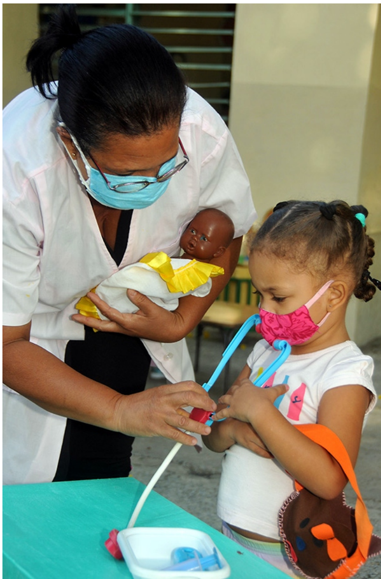
Después del 26 de junio los círculos infantiles y seminternados continuarán brindando servicios solo a las madres que sean imprescindibles en sus puestos de trabajo.

Esta provincia ha visto incrementar sus niveles de transmisión del nuevo coronavirus, especialmente en su capital. De hecho, ya superó los dos mil casos positivos al SARS-CoV-2 desde que Cuba notificó el primero en marzo del 2020. Alcanzar los mil le tomó a la tierra de Vicente García más de un año. Ir desde ese primer millar al segundo, apenas un mes y 13 días.