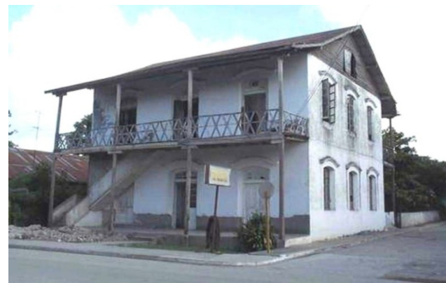
El Museo Municipal de "Jesús Menéndez" lleva su nombre.