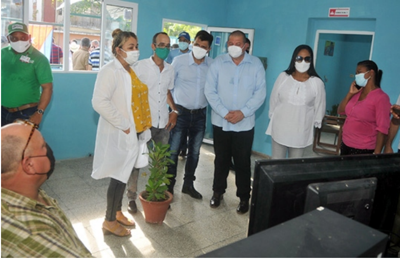
Instante del recorrido por la clínica veterinaria.

Por Luz Marina Reyes Caballero y Yuset Puig Pupo