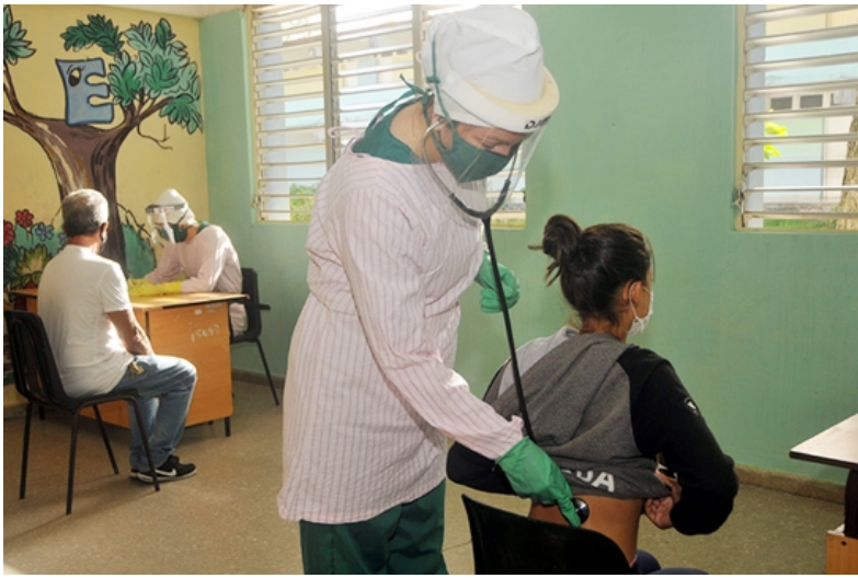
Por Misleydis González y Yuset Puig

EL AJETREO inusual en una de las entradas del seminternado Jesús Argüelles Hidalgo advierte, desde el fin de semana, que el centro de estudios ha acogido al personal de Salud Pública para apoyar la lucha contra la Covid-19. Con el objetivo de evitar las aglomeraciones y mejorar la calidad de la atención médica, en un ala de la escuela se ha creado una extensión de la consulta de infecciones respiratorias agudas (IRAS) del policlínico Guillermo Tejas.