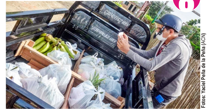
Mercasa incorporó la compra de combos de alimentos a través del teléfono 31379910. A las ofertas de Tonerito.com se puede acceder llamando al número 31349092.