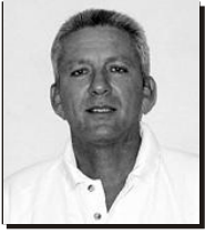
Por Juan Morales Agüero