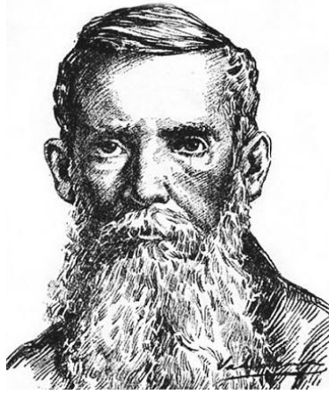
Francisco Vicente Aguilera.

Fue la finca de Aguilera el lugar predilecto para acoger los campamentos mambises y las reuniones más significativas de la primera etapa de la guerra. En especial, Vicente García González estableció en la zona de El Lavado su campamento principal, desde donde dirigiría durante los 10 años de la contienda importantes acontecimientos en los que estuvo involucrado.