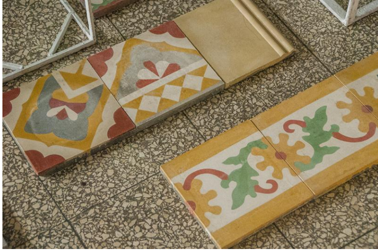
Las losas coloniales tuneras son fuertes candidatas para la exportación.

"Hasta la fecha, confirma, se ha realizado la firma de varios contratos como parte del proceso negociador que tiene lugar entre las empresas exportadoras con