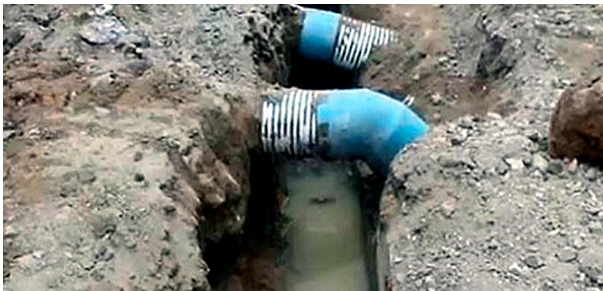
Los alcantarillados simplificados son tramos cortos de tuberías en pocas cuerdas que no demandan gran cantidad de materiales para su construcción y pueden generar una solución más inmediata al problema.

La provincia cuenta con carros fosa en todos los municipios, salvo en Colombia, y los conocedores confirman que es suficiente para hacerles frente a las demandas actuales. Acueducto y Alcantarillado, por su parte, sigue dando prioridad a los casos reiterativos, y a controlar que el aumento de los precios no sea excusa para las indisciplinas y ocurra un incidente sanitario.