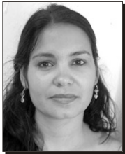
Por Yelaine Martínez Herrera